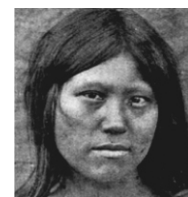
මොන්ගොලොයිඩ් (ල. 4)

ii. පහත සඳහන් වන්නේ ජලයේ බිහි වූ ජීවින් ගොඩබිමේදී විවිධ සතුන් ලෙස වර්ධනය වූ ආකාරයයි. එම සත්ව වර්ග අදාළ පිත්තූර වලට ගැලපෙන පරිදි යා කරන්න.