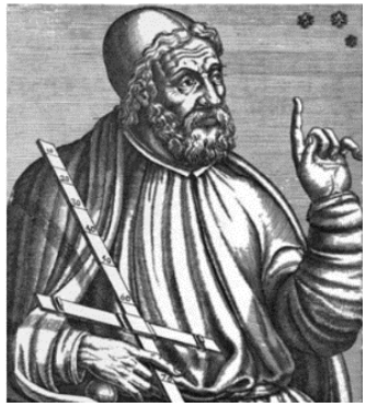
(ලකුණු 04 යි)